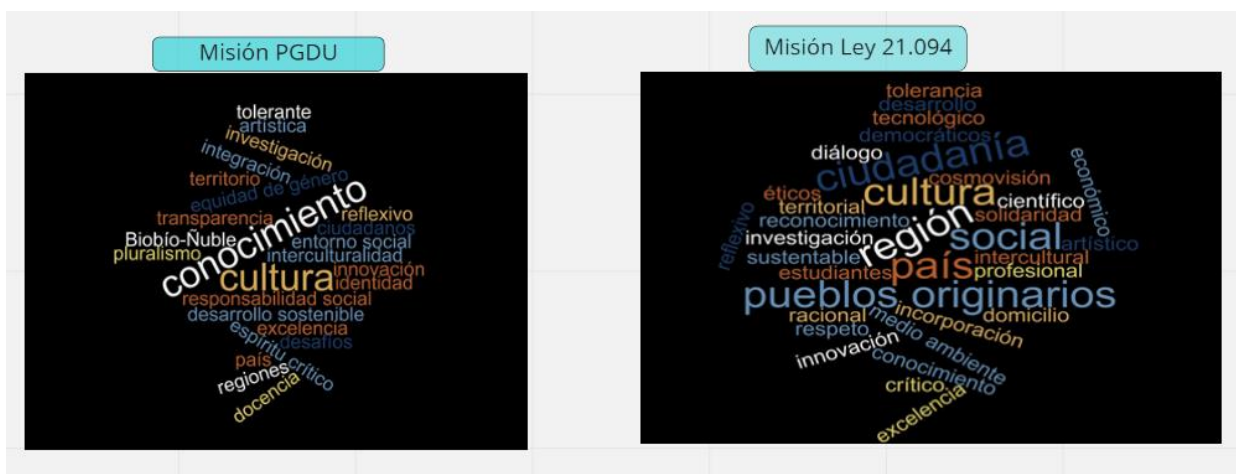
Ilustración 1 Misiones PGDU y Ley 21.094

Para facilitar la discusión se presentaron nubes de palabras de los textos establecidos por el PGDU 2020 y la Ley de Universidades Estatales (21.094/2018), para la Misión. Luego de compartir con los participantes las nubes de palabras, se introdujo siguiente la pregunta: